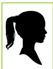
Vælges senere Elevrepræsentant